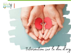
Intervention sur le don d'organes

Dans le cadre du 'Parcours Santé', les élèves de 3 ème se rendront en janvier prochain en salle St Gabriel pour assister à une intervention sur le don d'organes selon le planning suivant :