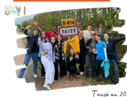
Taizé en 2025 !

Pèlerinage à Taizé (Bourgogne) du dimanche 6 (8h) au vendredi 13 avril (20h30) avec JeunesCathocambrai (pastorale des Jeunes du diocèse de Cambrai).