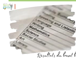
Résultats du brevet blanc

Une fiche intitulée 'résultats du brevet blanc n°1' a été remise à chaque élève de 3 ème . Elle récapitule les notes obtenues à chaque épreuve écrite du brevet ( français, mathématiques, histoire géographie EMC, sciences ), la note obtenue à l'épreuve orale de stage de l'an dernier ainsi que le niveau de compétences atteint par les élèves en ce début d'année.