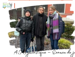
AS Gymnastique – Examen de juges

Le mercredi 15 janvier , l'examen de juges de gymnastique s'est déroulé au collège Ste Marie à Aire-sur-la-Lys, réunissant les élèves de tous les établissements des Hauts-de-France. Cet événement a attiré 150 participants, démontrant l'engouement et l'engagement des jeunes pour cette discipline.