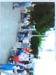
Jeunes au service des malades