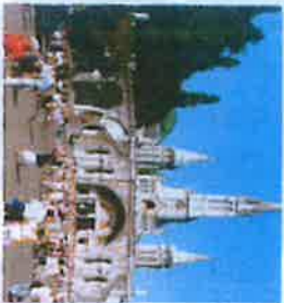
La Basilique de l'Immaculée Conception La Basilique du Rosaire

La source mise au jour par Bernadette le 25 février 1858.