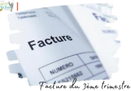
Facture du 3ème trimestre

Votre facture du 3 ème trimestre est consultable via École Directe depuis le mardi 02 avril 2024 .