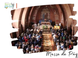
Messe de Pâques

Je te souhaite le meilleur dans ton voyage spirituel. Puisses-tu trouver tout ce que tu recherches. Je vous souhaite, à toi et à ta famille, toute la grâce et l'amour de Dieu pour ce jour spécial. Puisse cette sainte occasion t'apporter beaucoup de joie et de souvenirs heureux.