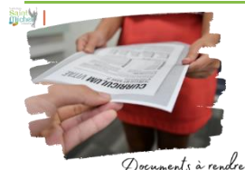
Documents à rendre