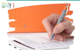
Fiche navette d'orientation

Le cadre 3 (page 2) de la fiche navette d'orientation (jaune) est à compléter et à signer par les 2 parents et l'élève.