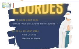
Plus de Lourdes avant Lourdes en 2024 !

Pour 2024 , Jeunes Cathocambrai propose pour la 1 ère fois de vivre un « Plus de Lourdes avant Lourdes », c'est-à-dire de vivre une dimension de pèlerinage supplémentaire ( du jeudi 15 au mardi 20 août 2024 ) juste avant les dates du pèlerinage diocésain ( du mardi 20 au lundi 26 août 2024 ).