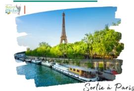
Sortie à Paris

Afin de concrétiser différents apprentissages réalisés au cours de l'année de 2° en histoire, de 1° H.L.P. en littérature et de préparer l'année de T° en H.G.G.S.P., un voyage est organisé à Paris. Au programme, croisière en bateau mouche sur la Seine à la découverte du patrimoine architectural de Paris, visite du musée du Louvre et des départements consacrés à la Renaissance et pièce de théâtre sur le droit des femmes « Et pendant ce temps Simone veille ! ».