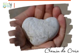
Chemin de Croix

110 élèves s'étaient inscrits pour parcourir et prier le chemin de croix vendredi 29 mars 2024 . La météo prévue n'était pas clémente, nous nous sommes donc retrouvés dans la chapelle et en avons parcouru le contour pour prier grâce aux peintures qui ornent les murs.