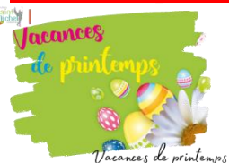
Vacances de printemps

Nous vous rappelons qu'il n'y aura pas cours les lundi 06 et mardi 07 mai 2024 mais que ces deux jours seront « rattrapés » les lundi 22 et mardi 23 avril 2024 .