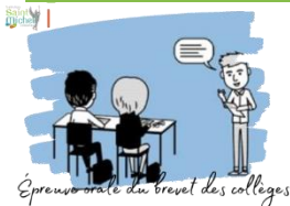
Épreuve orale du brevet des collèges

Afin d'aider les élèves qui ont choisi de présenter une partie de leur épreuve orale du brevet des collèges dans une langue étrangère à obtenir le bonus de 20 points possible, ils participeront à des séances de préparation :