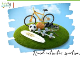
Raid activités sportives

Si tu aimes la nature et le sport alors ce qui va suivre est peut-être pour toi !!!