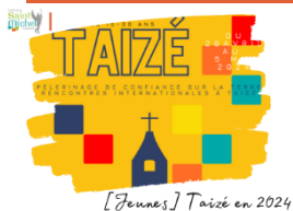
[Jeunes] Taizé en 2024

Du dimanche 28 avril au dimanche 05 mai 2024