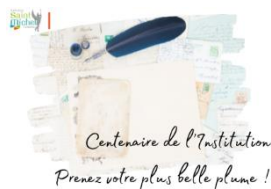
Centenaire de l'Institution Prenez votre plus belle plume !