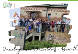
Jumelage avec Düsseldorf - Benrath

Nous venons de passer une agréable semaine en compagnie de nos correspondants allemands de Benrath qui ont pu profiter de belles journées ensoleillées.