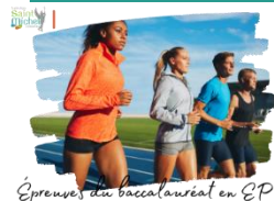
Épreuves du baccalauréat en EPS

Évaluations de l'enseignement de l'E.P.S. au baccalauréat général. Enseignement obligatoire en C.C.F. (contrôle en cours de formation).