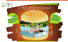
Offre Maxi Best Of Jeunes Cathocambrai

Parce que quand on aime on ne compte pas, et que quand on aime le Seigneur, on ne peut pas faire le tri !