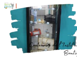
Centenaire de l'Institution Boutique

https://boutique.saint-michel-solesmes.com . Les articles achetés sur notre boutique sont à retirer sur place.